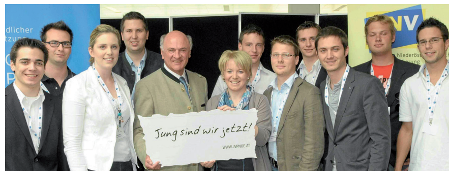
Stark vertreten war die JVP Gumpoldskirchen auch bei der Landeskonzferenz.

Clubbing. Alle Infos findet Ihr auf unserer neuen Homepage: www.jvp-gumpoldskirchen.at